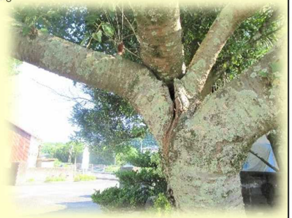
【正門近くの桜の木】